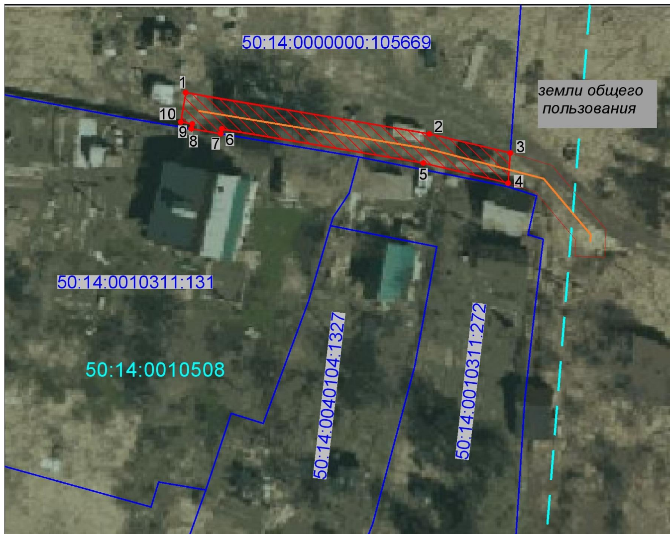
Схема границ публичного сервитута